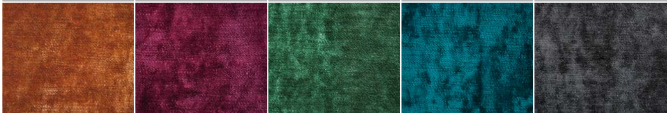
ROMEO 67 COPPER