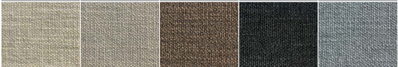
HARRIS 02 FLAX

620 G/M 2 50% ACRYLIC 20% WOOL 15% POLYESTER 10% COTTON