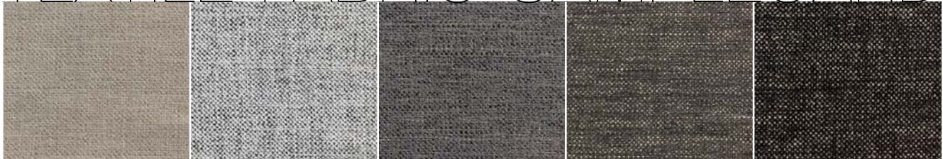
IGOR 03 SAND

380 G/M 2 50% POLYPROPYLEN 35% VISCOSE 15% COTTON