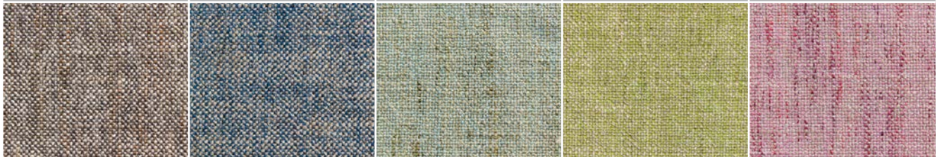
YUMA 25 STONE

380 G/M 2 40% LINEN 30% COTTON 20% ACRYLIC 10% POLYESTER